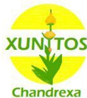
Asdo.: Xuntos por Chandrexa