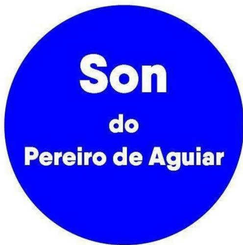
Asdo.: Son do Pereiro de Aguiar.