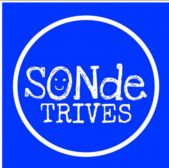
Asdo.: Son de Trives.